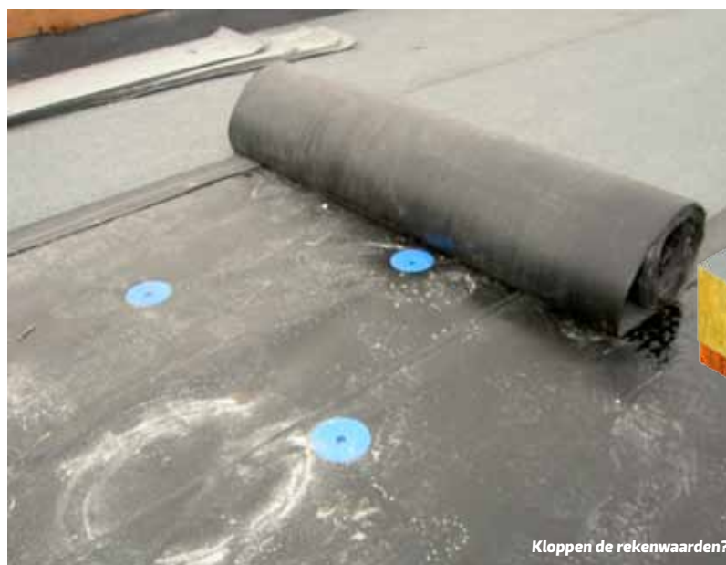
Kloppen de rekenwaarden?